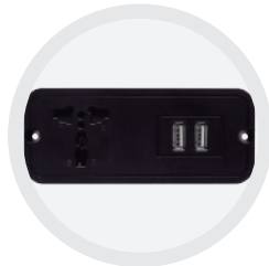
Prise Multizone et USB