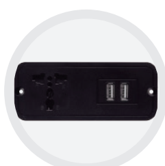
Prise Multizone et USB