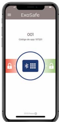
ouverture & admin